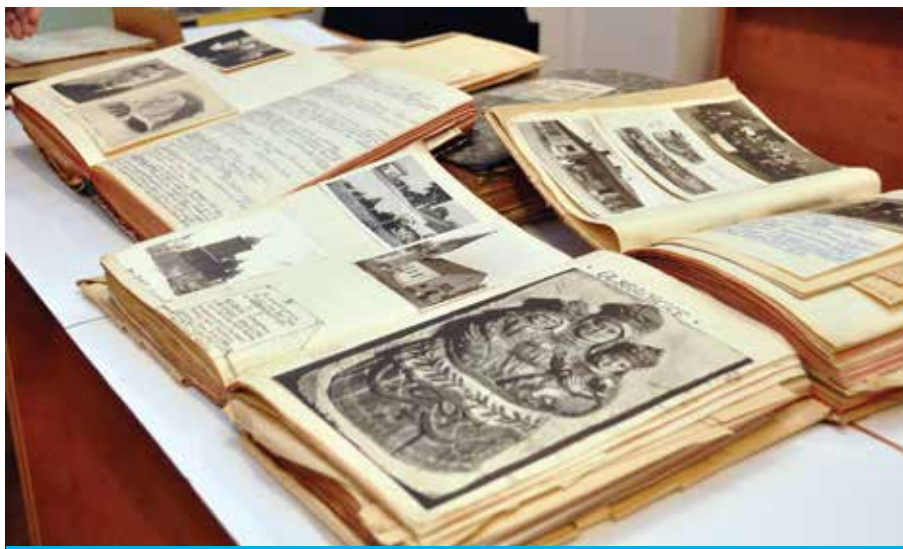
Księgi z materiałami dotyczącymi miejscowości. Na pierwszym planie księga dokumentująca historię i losy mieszkańców Stonawy, Olbrachcic, Cierlicka i Łąk.