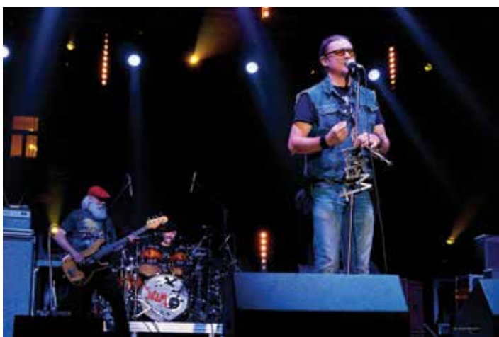
Gwiazdą sobotniego wieczoru był zespół Dżem...