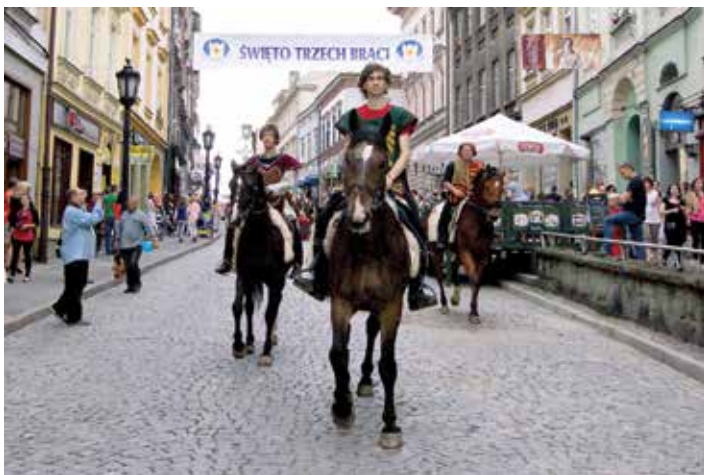
Bohaterowie Święta Trzech Braci - Bolko, Leszko i Cieszko.