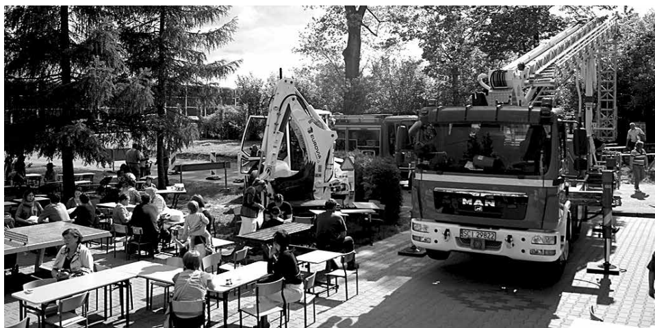
SP 7 otworzyła w szkolnym ogrodzie Zielony Zakątek, a w nim Zieloną Eko-Klasę. Częścią programu majówki były także ćwiczenia ewakuacyjne na wypadek pożaru, przeprowadzone pod nadzorem Jednostki Państwowej Straży Pożarnej w Cieszynie.