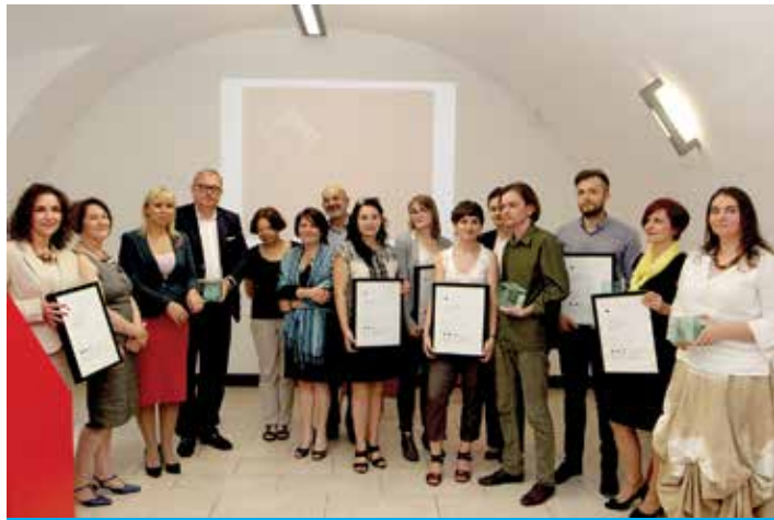
Laureaci ósmej edycji konkursu „Śląska Rzecz”.