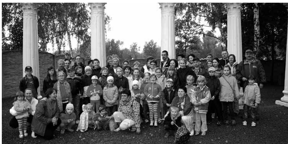
Uczestnicy wycieczki zorganizowanej przez Hospicjum im. Łukasza Ewangelisty.

Na zbiórkę wszyscy przyszedli punktualnie i z dobrymi humorami. Celem naszej podróży była gmina Zator, położona u stóp Pogórza Karpackiego w Kotlinie Oświęcimskiej nad rzeką Skawą. Na miejscu przywitała nas muzyka, po czym Pani Przewodnik wprowadziła nas na teren Parku Dinozaurów. Największą atrakcją była ścieżka edukacyjna w starym lesie, na której roiło się od ożywionych prehistorycznych gadów, które wydawały dźwięki, machały ogonem, ruszały się i były, mimo swoich ogromnych