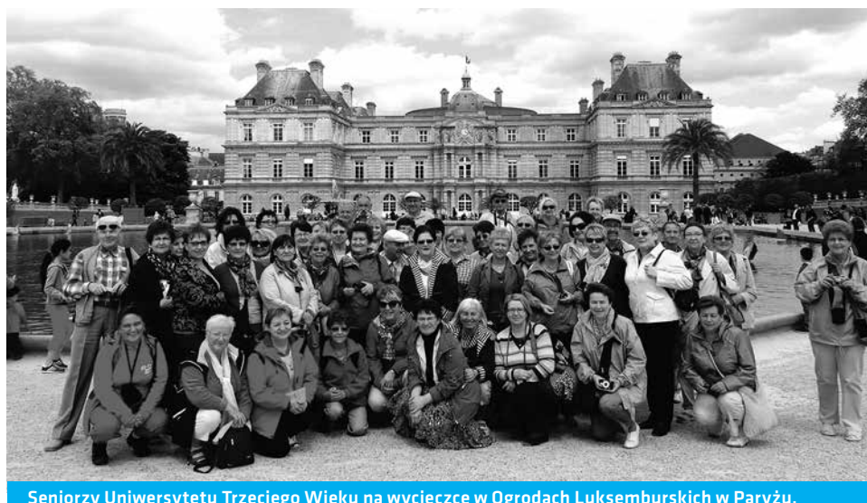
Seniorzy Uniwersytetu Trzeciego Wieku na wycieczce w Ogrodach Luksemburskich w Paryżu.

Zebrań zakończyło się przemówieniem Pani Prezes, która podziękowała wszystkim przybyłym seniorom za 9-letni udział w tworzeniu tak wspaniale działającego Stowarzyszenia, składając równocześnie rezy-