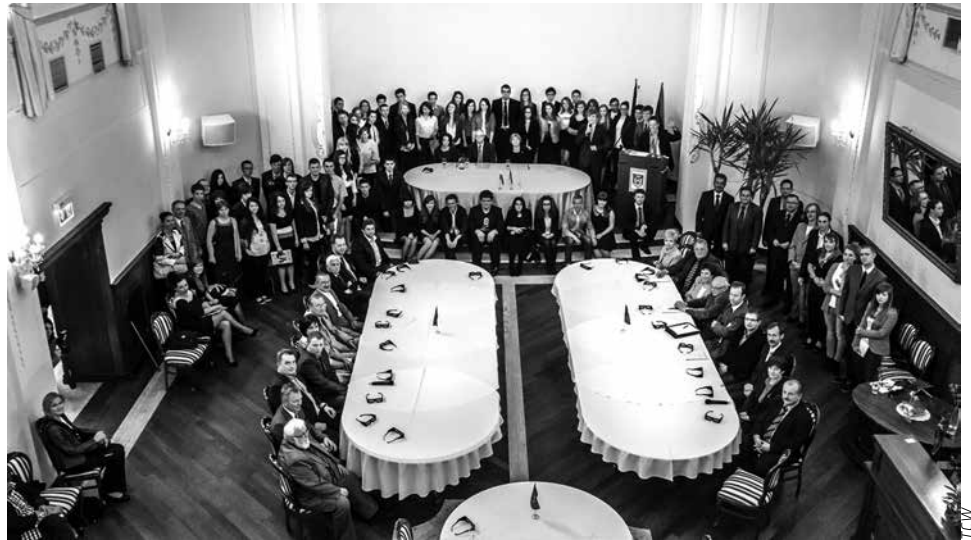
W maju zainaugurowano Transgraniczny Parlament Młodzieży.