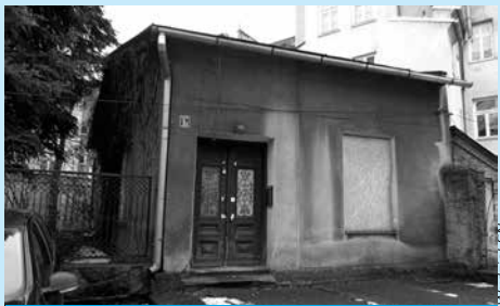
Działka przy ul. Chrobrego 1A przeznaczona na sprzedaż.

Burmistrz Miasta Cieszyna ogłasza, że w dniu 25 lipca 2013 r. w sali nr 13 Urzędu Miejskiego w Cieszynie (Rynek 1, I piętro) o godz. 10.00 odbędzie się ustny przetarg nieograniczony na sprzedaż działki zabudowanej oznaczonej w ewidencji gruntów nr 81/1 obr. 41 o pow. 0,0120 ha, zapisanej w księdze wieczystej nr BB1C 00058125/1 Sądu Rejonowego w Cieszynie, położonej w Cieszynie przy ul. Chrobrego 1A. Działka jest zabudowana budynkiem oficyny. Budynek jest parterowy, podpiwniczony ze strychem nieużytkowym, murowany, wybudowany w technologii tradycyjnej. Powierzchnia użytkowa budynku wynosi 30,1 m 2 .