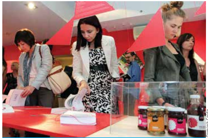
Wystawa pokonkursowa w Zamku Cieszyn będzie pokazywana do 28 lipca.