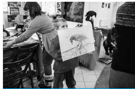
Zamek zaprasza na wystawę prac uczniów Szkoły Malarstwa, Rysunku, Fotografii i Myślenia.

„Nasi uczniowie stworzyli fascynujące i niepowtarzalne prace – piękne kolorowe obrazy, ciekawe rysunki, intrygujące fotografie i filmy. Walczymy z powszechnym przekonaniem, że od pewnego wieku na naukę jest już za późno, a prace małych dzieci są tylko infantylną interpretacją rzeczywistości. Wierzymy, że każdy kto myśli, może nauczyć się rysować, malować, fotografować i choć tro-