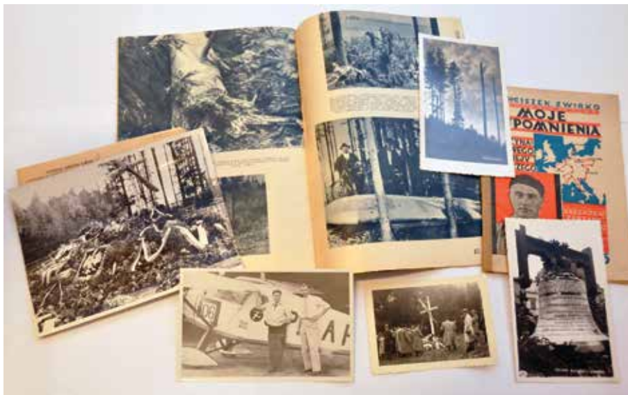
Materiały dotyczące polskich lotników Franciszka Żwirki i Stanisława Wigury oraz katastrofy w Cierlicku na Kościelcu we wrześniu 1932 r., w której zginęli.