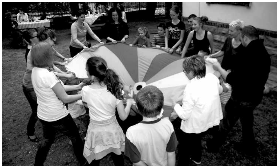
Istotnym celem projektu była praca z całą rodziną, wzmocnienie więzi między dziećmi i rodzicami.

„Kontakt” (ul. Ks. Janusza 3) dostępna jest wystawa prac ceramicznych i fotograficznych wykonanych przez uczestników projektu, dostępna dla wszystkich.