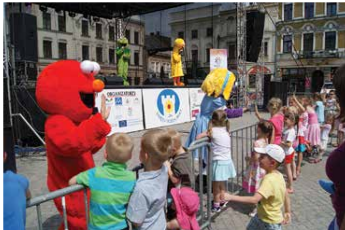
Dzieci cieszyły spotkanie z bohaterami Ulicy Sezamkowej.