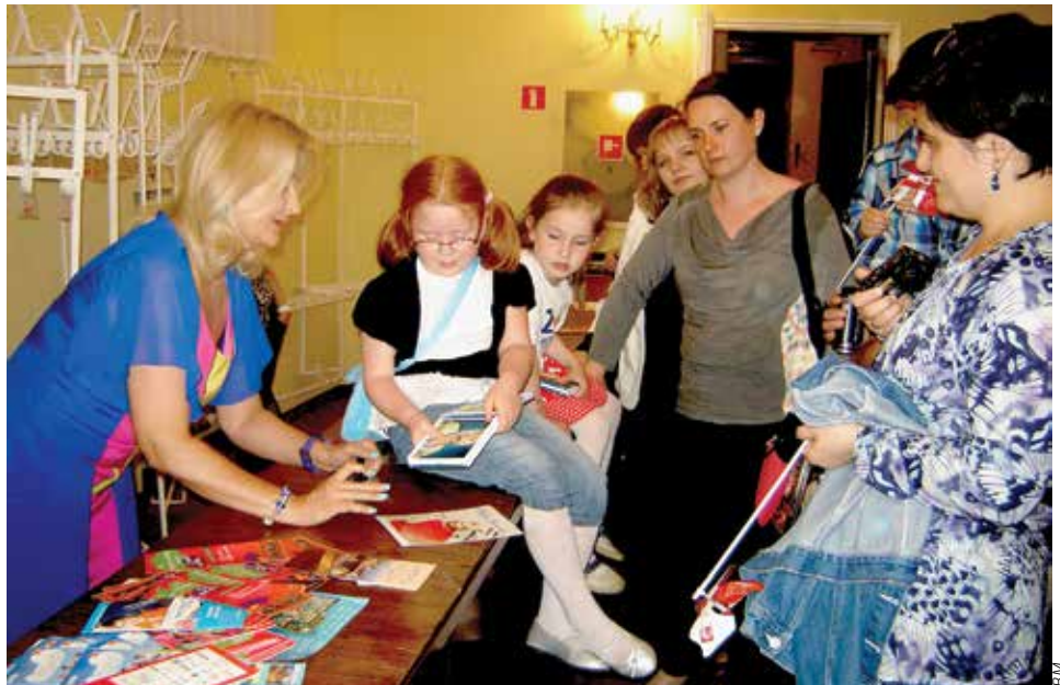
Majka Jeżowska, po swoim udanym występie, rozdawała autografy młodym fanom.