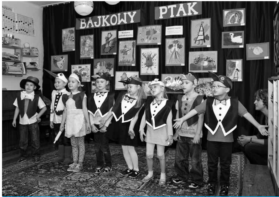
Rozstrzygnięciu konkursu towarzyszył występ artystyczny w wykonaniu przedszkolaków.