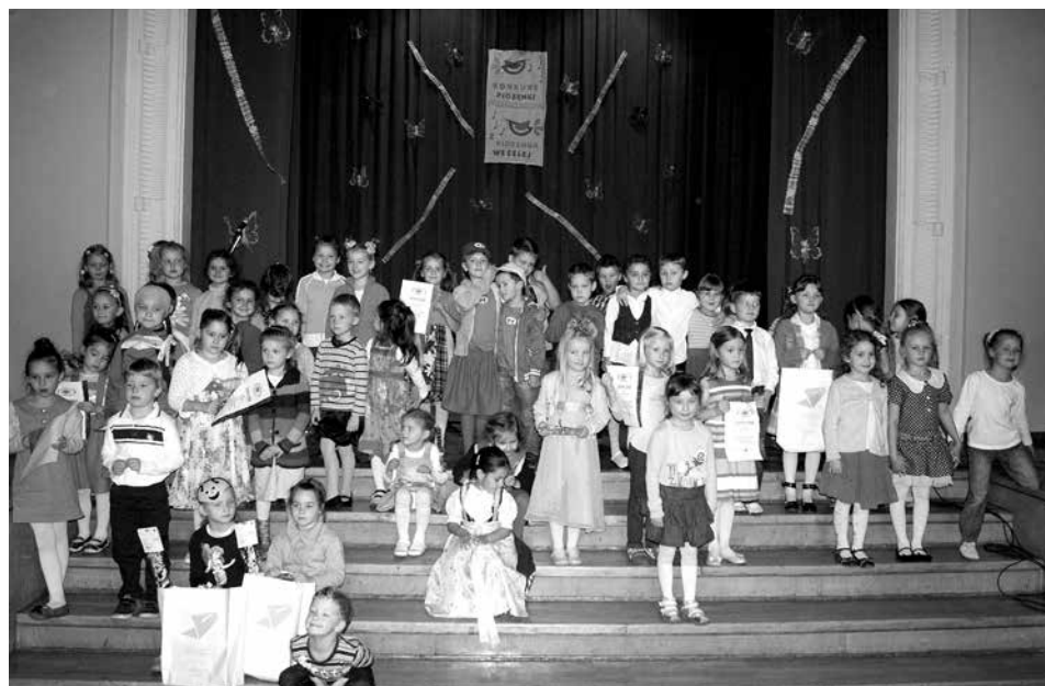
Uczestnicy konkursu „Z piosenką weselej”.