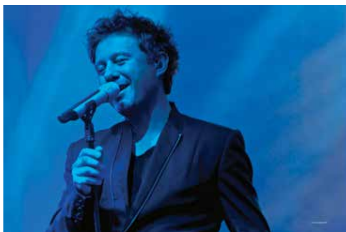
...a dzień wcześniej koncert zagrał Andrzej Piaseczny.