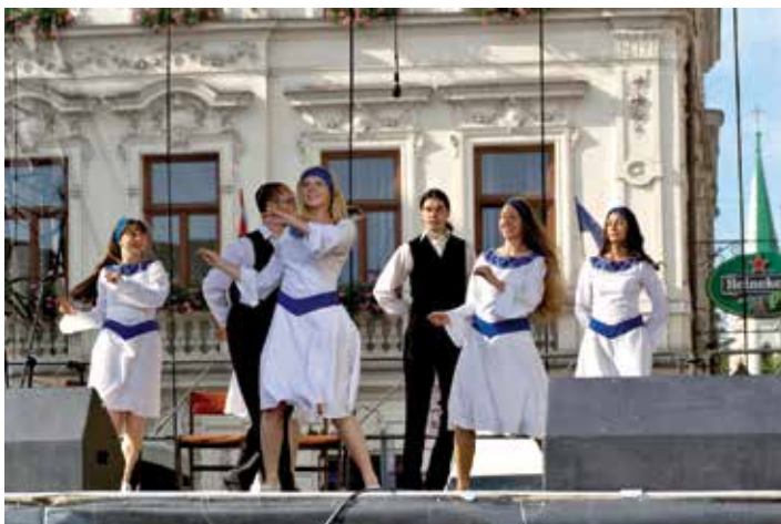
Pokaz tańców żydowskich w wykonaniu zespołu Klezmer.