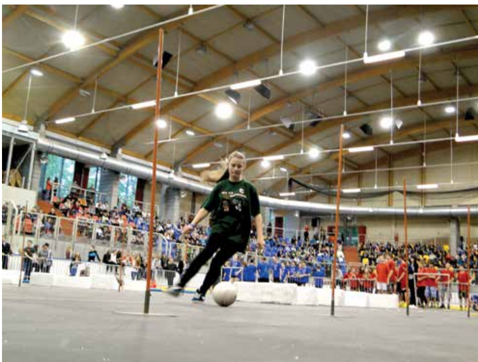
Młodzież musiała pokonać tory przeszkód w sześciu sportowo-rekreacyjnych konkurencjach.