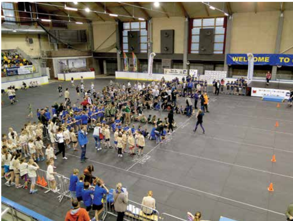
Z okazji Dnia Dziecka, pod hasłem „Baw się bezpiecznie”, rywalizowały ze sobą reprezentacje wszystkich cieszyńskich podstawówek i gimnazjów.